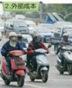
圖3-4-4 汽機車排放廢氣／現行油品在油價中加徵空汙費，用來改善空氣品質。