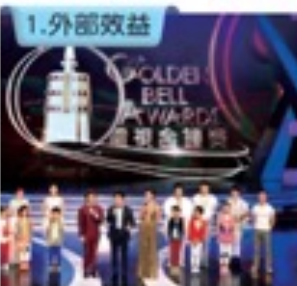
圖3-4-3 金鐘獎頒獎典禮／文化部設置金鐘獎，鼓勵廣播電視事業的發展。